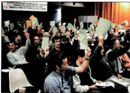
ALLES UNBESTRITTEN und einstimmig. TOUT A ÉTÉ ADOPTÉ À L'UNANIMITÉ et sans opposition.