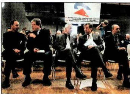
AVIATISCH INTERESSIERT: Ehrengäste. CAPTIVÉS PAR L'AVIATION: les hôtes d'honneur.