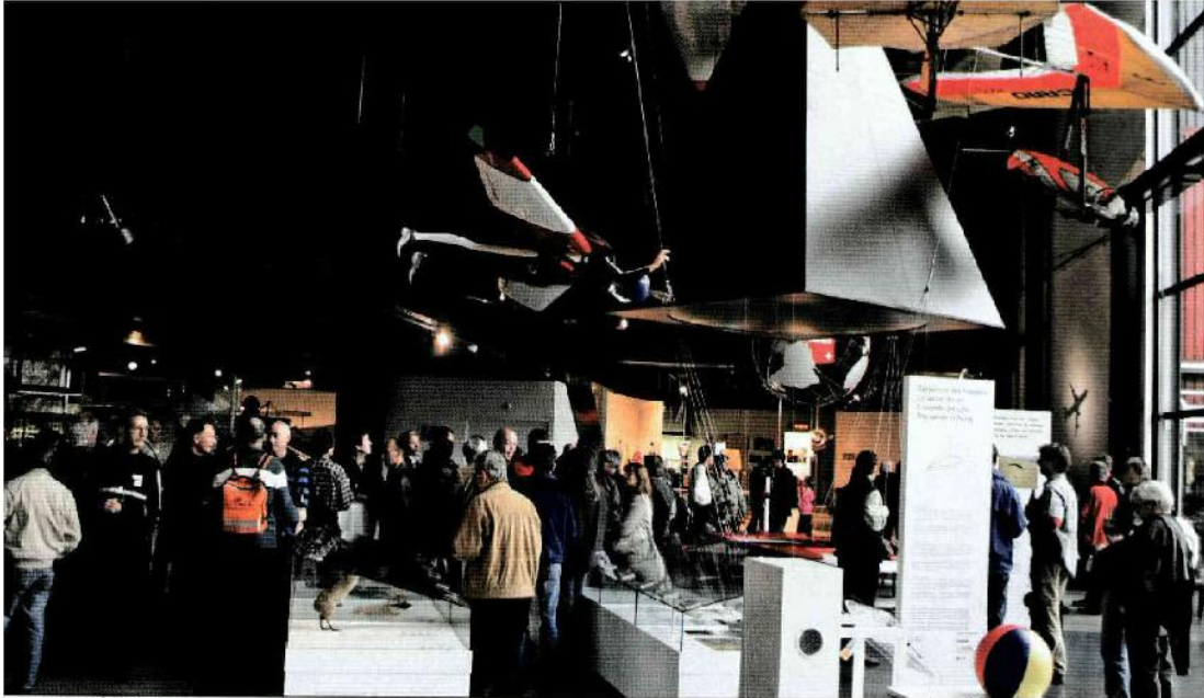
APÉRO in der Halle Luft- und Raumfahrt. APÉRO dans la halle de l'aviation et de la navigation spatiale.