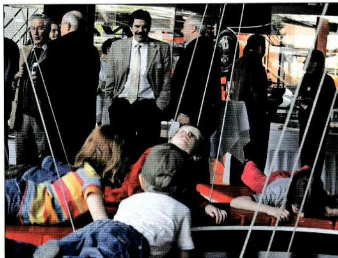
INTERESSIERTE JUGEND, arrivierte Junggebliebene. TOUS FASCINÉS, les jeunes d'aujourd'hui et les restés jeunes de la vieille garde.