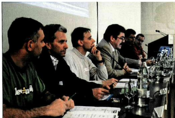
BEWÄHRTER THINKTANK: Der SHV-Vorstand. NOTRE MACHINE À PENSER: comité FSVL.