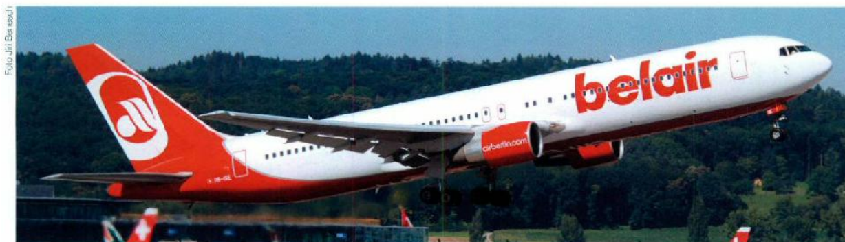
Die Boeing 767 von Belair trägt als einziges Flugzeug der Air-Berlin-Gruppe Belair-Titel. Damit soll gezeigt werden, dass es sich um eine Schweizer Airline handelt. Zudem ist die Aufschrift aus verkehrsrechtlichen Gründen in Kanada und Mexiko wichtig.