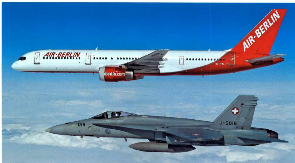
Die Boeing 757 von Belair kommen auch auf Flügen der Eligenossenschaft in den Kosovo zum Einsatz. Am 3. April führte die Luftwaffe mit der Staffel 18 auf einem solchen Flug eine Luftpolizeiübung durch.