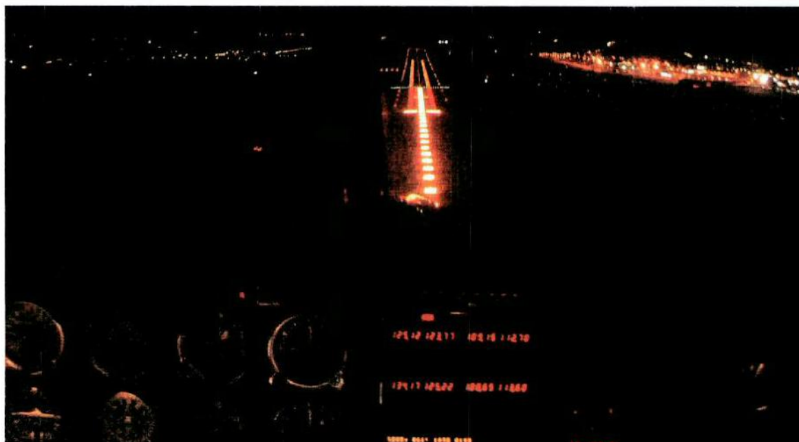
Ob der Zürcher Fluglärminitiative mit erweitertem Nacht- flugverbot würde der Hub Zürich «erstickt».