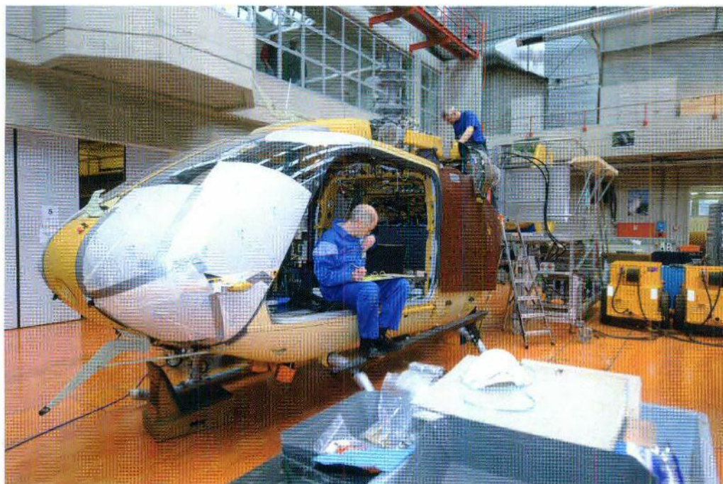
Completion line der RUAG in Alpnach für die EC 635 der Schweizer Luftwaffe.