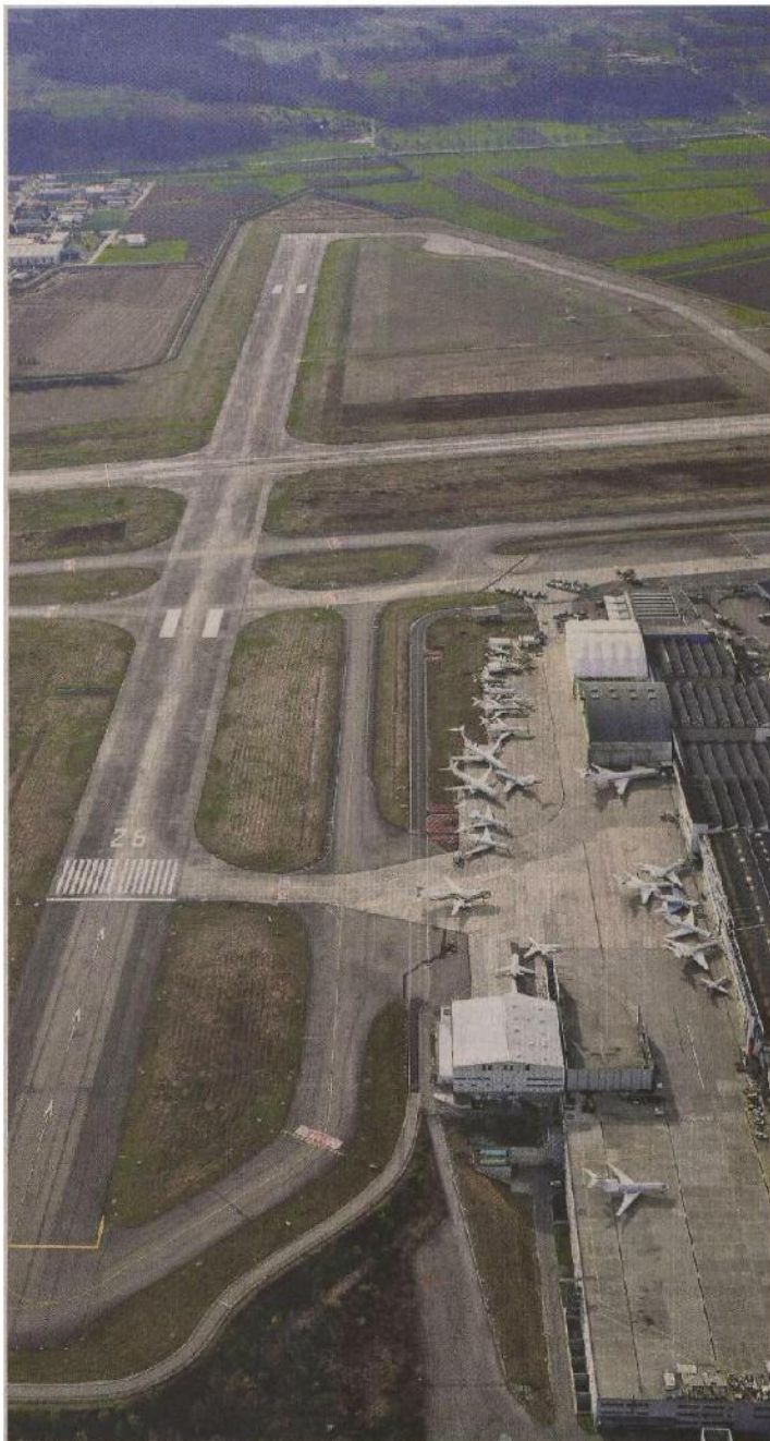
600 Meter länger. Die Ostwest-Piste des EuroAirports kann nur nach Westen (im Bild oben) verlängert werden.

Die Idee einer Verlängerung stösst auf Interesse, aber auch auf Hindernisse