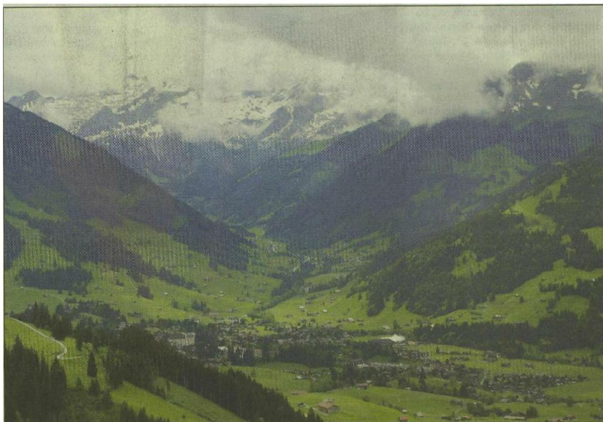
Zwar kein Gletscherflug, aber trotzdem traumhafte Aussichten: über Gstaad.

Sein 50-Jahr-Jubiläum wollte der Verband der Schweizer Aviatik-Journalisten (SAJ) mit einem besonderen Ausflug krönen. Ein Gletscherflug war geplant. Doch das Wetter machte den Fachjournalisten leider einen Strich durch die Rechnung.