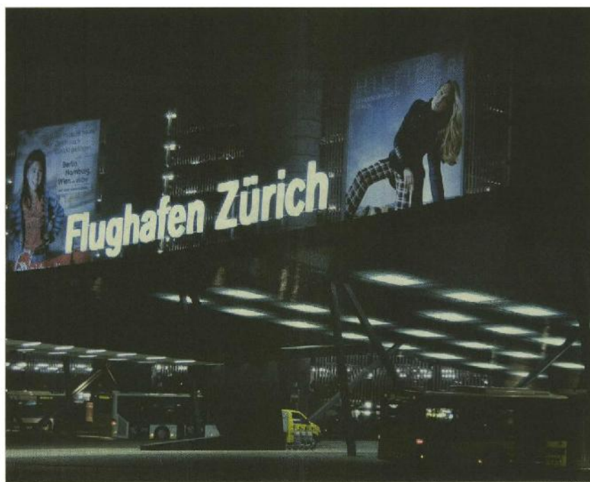
Kunststück: Die Kosten sollen auch in Kloten gesenkt werden, ohne Qualität und Arbeitsplätze abzubauen.

Erster Auftritt des neuen Chefs des Bundesamtes für Zivilluftfahrt