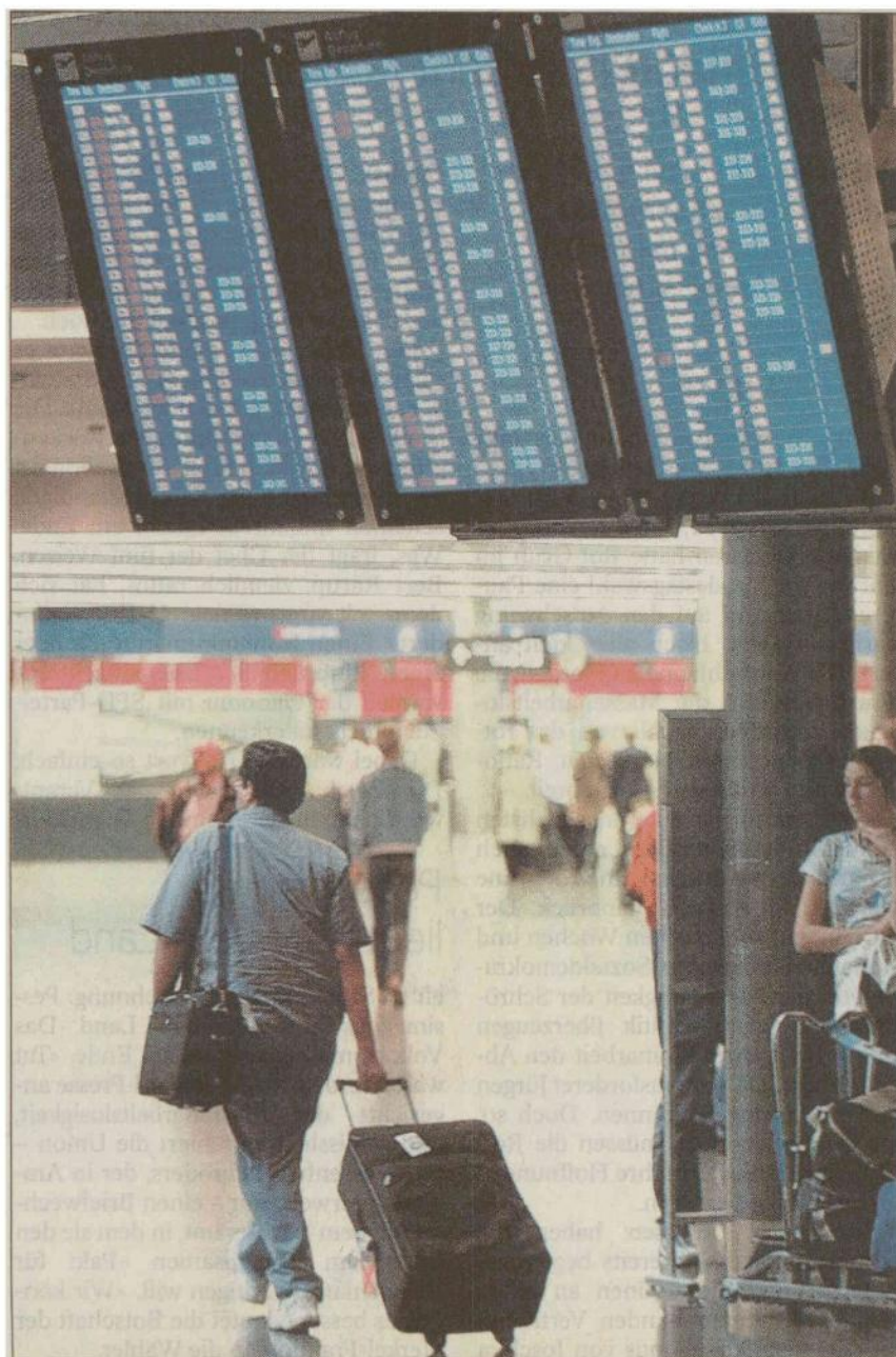
Interkontinental-Direktverbindungen Wenn diese aufrechterhalten werden und Zürich ein Hub bleibt, wäre die Lufthansa willkommen.