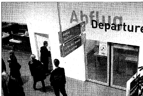
Auch Flughafen-Direktor Charles Riesen (oben rechts) muss künftig durch die Sicherheitskontrolle, um in den Bereich hinter der Passkontrolle (unten rechts) zu gelangen. Auch der Zaun um das Flughafengelände muss den Sicherheitsstandards angepasst werden (links).