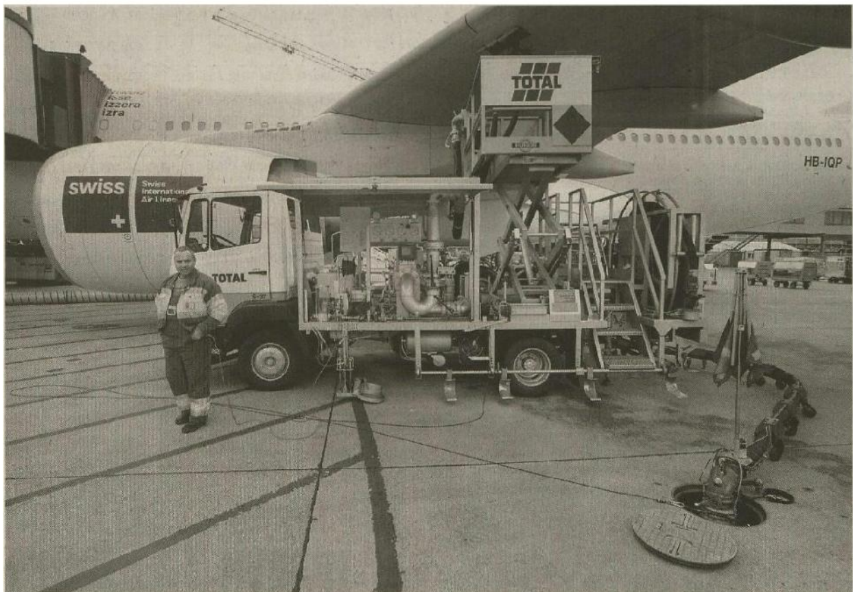
Flugbenzin belastet die Umwelt. Welchen Preis das haben darf, ist die Frage.

Durch eine Verteuerung des Flugbenzins in der EU könnte die Schweiz als Hub für die Branche attraktiver werden