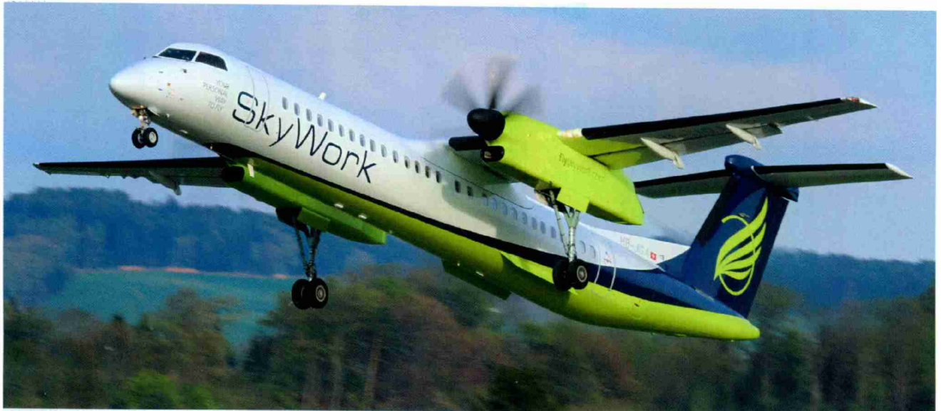
Die erste Dash-8Q400 von SkyWork Airlines, die HB-JGA, beim Start in Bern. SkyWork wird in den kommenden Monaten eine dritte Q400 in Dienst stellen. Für den Sommerflugplan 2012 ist eine Flotte von drei Q400 und vier Do328 geplant.

Themen-Nr.: 645.7 Abo-Nr.: 1073485 Seite: 5 Fläche: 122'629 mm 2