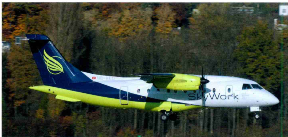
Mit der HB-AEO ist im September die dritte Dornier 328 zur SkyWork-Flotte gestossen. Sie setzt sich derzeit aus zwei Dash-8Q400 und drei Dornier 328 zusammen.

Weil ein Berner ab Bern fliegt. Im Ernst, bei uns haben Sie mehr Sitzplatzabstand und Sie haben eine freundliche Crew. Und Sie sind viel schneller im Flugzeug und nach der Landung wieder ausserhalb des Terminals. Und wo kann man 25 Minuten vor Abflug noch einchecken und ist trotzdem pünktlich auf dem Flieger? Natürlich können wir nicht mit denselben Preisen wie Swiss mithalten... noch nicht.