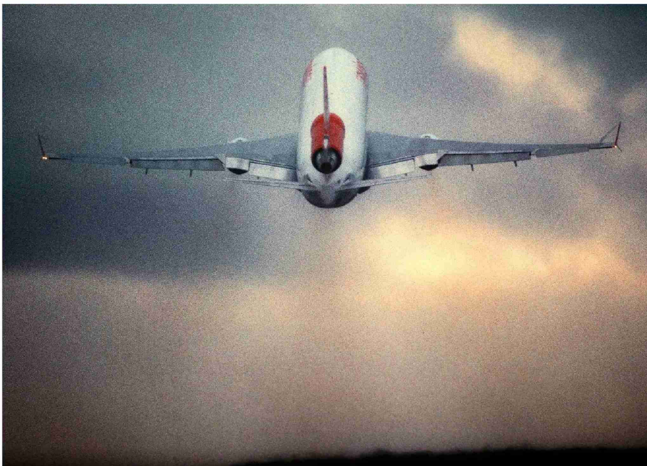
Abheben von und nach Europa kostet die Swiss künftig mehr - bald auch bei Flügen mit Start- oder Zielland Schweiz?

Ab 2012 müssen Fluggesellschaften für ihren CO 2 -Ausstoss in der EU Zertifikate kaufen. Die hiesige Luftfahrtindustrie befürchtet, dass die Schweiz die EU-Regelungen übernehmen könnte.